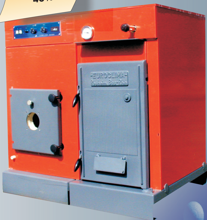
Chaudière bois fioul DF 99